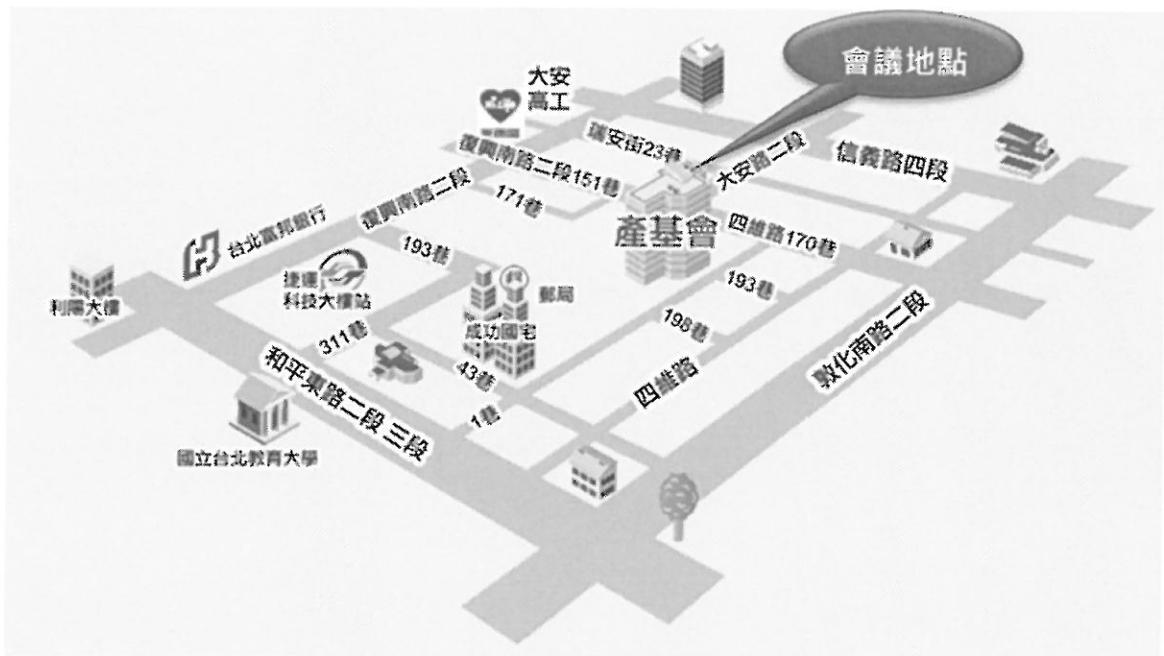
財團法人台灣產業服務基金會位置圖