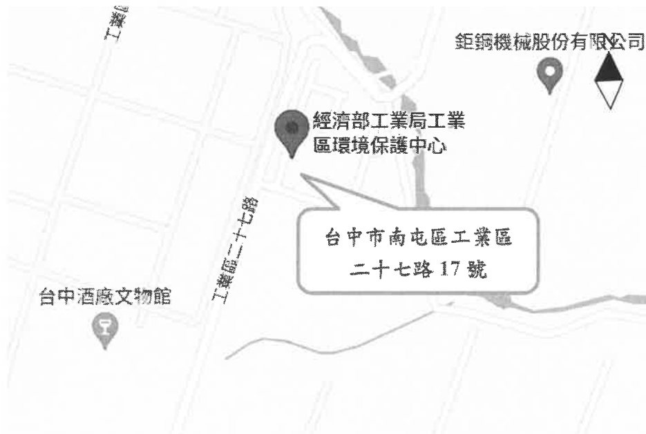
圖 1、經濟部工業局工業區環境保護中心交通位置圖

行駛國道一號→下南屯交流道(朝龍井方向)→走五權西路三段或 136 縣道→抵達目的地。