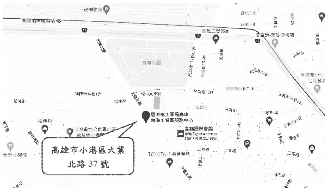
圖 2、經濟部工業局高雄臨海工業區服務中心交通位置圖

行駛國道一號→中山四路出口下交流道(往高雄航空站的方向走)→走中山 四路/西部濱海公路/台 17 線→右轉行駛到高雄的大業北路→抵達目的地。