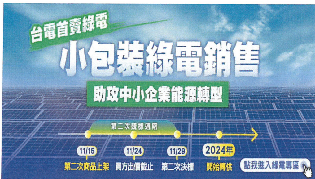
台電公司小額綠電標售期程

國際淨零碳排趨勢日漸抬頭，國內企業對綠電及憑證之採購需求快速攀升，經濟部標準檢驗局(下稱標準局)為協助綠電暨憑證供需雙方交易，提出多元解決方案，訂定「國營事業案場再生能源電力及憑證媒合服務作業程序」，並於國家再生能源憑證中心(下稱憑證中心)官網打造嶄新「綠電競標區」，與台灣電力股份有限公司(下稱台電公司)合作，供台電公司推出之「小額綠電銷售試辦計畫」使用。台電公司規劃 112 年 11 月 15 日於標準局憑證中心綠電媒合平台上架自建綠電供企業競標，歡迎各企業參與競標購買綠電。