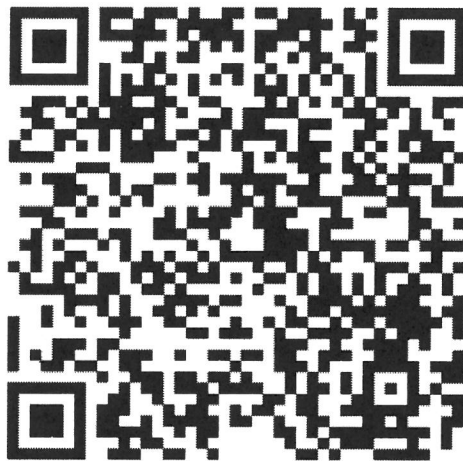
網路報名 QR code